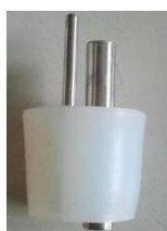
Accessorio: Cono adattatore per travasare damigiane da 54 lt. Dim. 48mm x 56mm x h 50mm